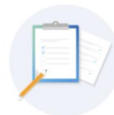
アンケート 回答の謝礼に