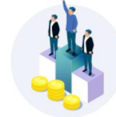
社内イベントの インセンティブに