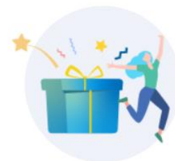
イベント参加者 への景品に