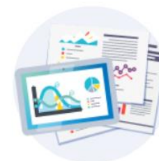
資料請求や 見積もりの謝礼に